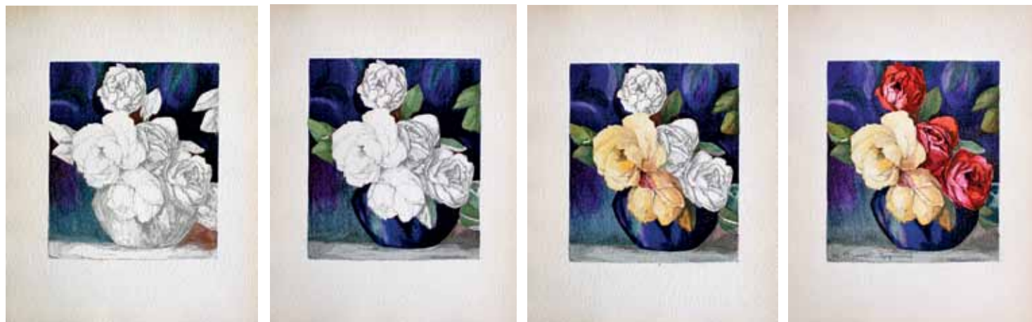
onder Marguerite Beauzée-Reynaud, De 32 fasen van een kunstwerk. (Bloemstuk 'Les roses', van Marguerite Beauzée-Reynaud). Te zien zijn drie tussenfasen, na resp. 5, 10 en 25 bewerkingen met 'patrons'. Tenslotte de eindfase, na 32 'patrons'.