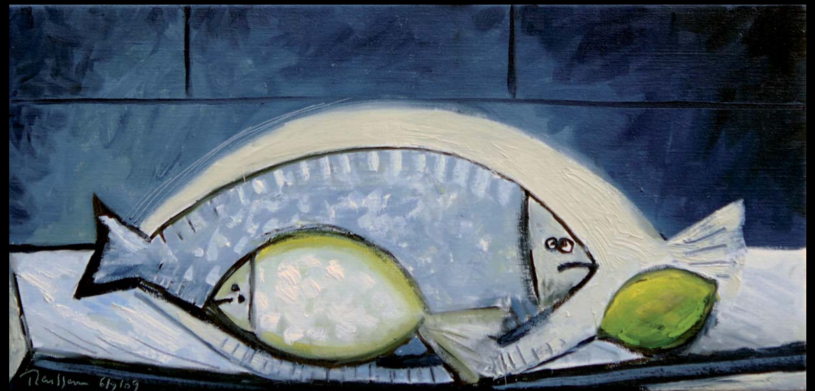
Two fish and a lemon