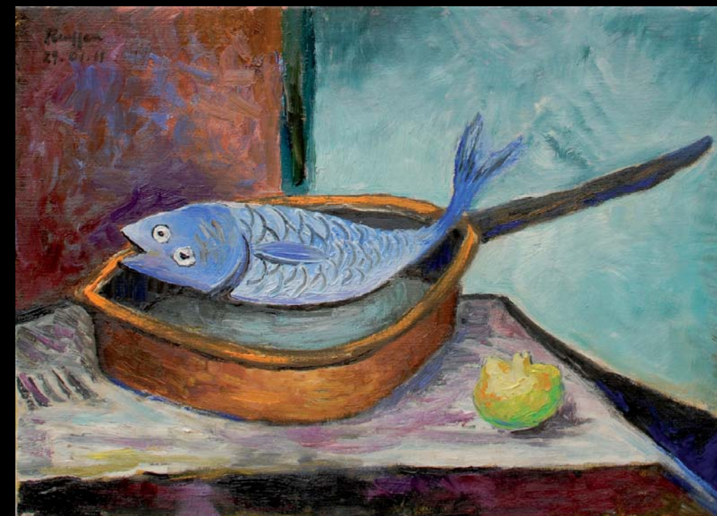
Fish in a copper pan