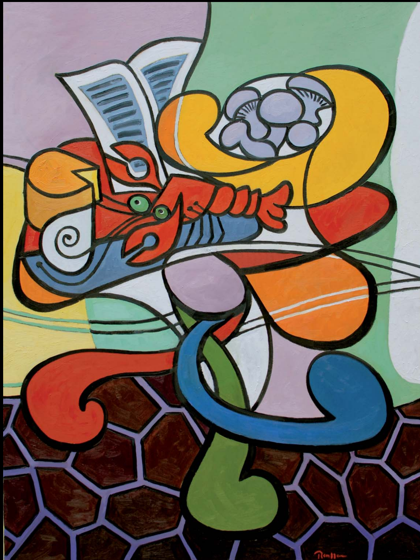
Lobster, Parmasan cheese and mushrooms on a table (naar een recept van Paul Fagel)